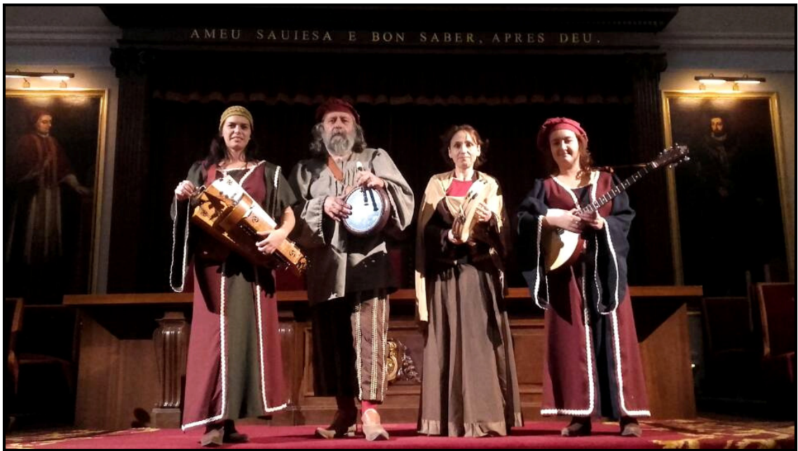
Actuación en el Paraninf de la Nau de la Universitat de València (2015)

Con este programa se pretende dar una visión amplia de la gama y las formas sonoras que han tenido lugar a lo largo de la Historia.