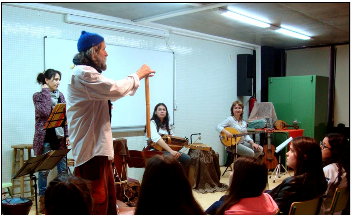
Actuación en el IES l'Alcalaten de l'Alcora (2016)